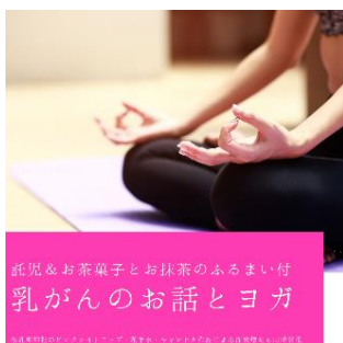
乳児とお茶菓子とお抹茶のふるまい付 乳がんのお話とヨガ