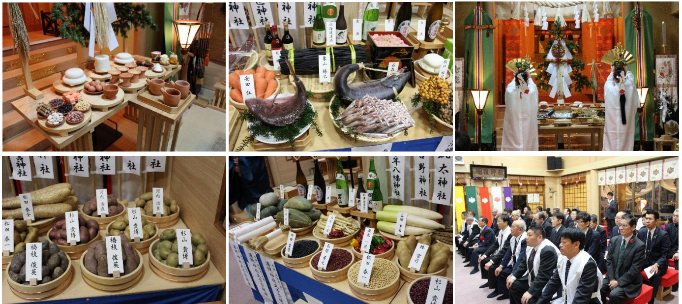
新嘗祭並びに収穫勤労感謝祭の様子

去る十一月二十三日、新嘗祭（にいなめさい）並びに収穫勤労感謝祭を無事に斎行申し上げた。このお祭りは、戦後途絶えていた新嘗祭を収穫勤労感謝のお祭りとして、平成十七年に先代宮司の唱導により、氏子会、浦幌町農業協同組合、浦幌町森林組合、大津漁業協同組合、浦幌町商工会、浦幌町建設業協会が発起人となり、生産者、企業、商店、神社関係者の賛同を得て、あらゆる産業の垣根を超えて収穫感謝の祈りを捧げ、あらゆる産業の交流を深めようとはじまったお祭りである。復活して以来、たくさんの方々の崇敬の念により、毎年浦幌町内で収穫された沢山の品々が机にお供えされる。地震、津波、台風、冷害など様々な自然災害もあったが、それらの苦難を乗り越え、平成から令和へと収穫感謝のお祭りが継承されたことに心より敬意と感謝を申し上げます。