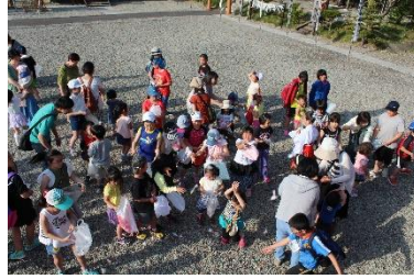
浦幌神社春季祭の様子